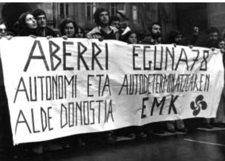
Autodeterminazioa aldarrikatu zen garaiko argazkia. PSOEko kideak ere antzeko pankarta batekin ibili ziren kalean.

egia Euskal Herriak ez zuela konstituzioa onartu, “marko” horretan eroso sentitzen dela erakutsi du... eta abar. Eta azken legegintzaldi honetan behin eta berriz errepikatzen den hitz “berri”ari erreparatu: “aventura” (soberanista hitza gehituz ala ez) Seguridadea eta egonkortasuna balore nagusizat barneratu diren honetan, hitz horrekin lortu nahi dena maltzurra dirudi: Terrorismo hitzak izua aktibatzen du; abenturak segurtasun eza, eta inseguridadeak, beldurra.